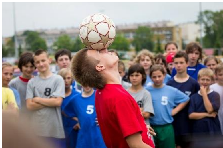
POKAZ FREESTYLE FOOTBALL – GRUPA BALLWIZARDS

Imprezie finałowej, która była zwieńczeniem trwających ponad dwa miesiące rozgrywek towarzyszyła świetna atmosfera. Swoje drużyny dopingowali nie tylko opiekunowie, ale również dyrektorzy szkół oraz władarze gmin, którzy licznie, na zaproszenie Pani Poseł, przybyli na Stadion Resovii Rzeszów. Podczas rozgrywek na twarzach dzieci gości zarówno uśmiech jak i łzy porażki, były niesamowite emocje, doping, rywalizacja – ale przede wszystkim była świetna zabawa. Spotkanie z młodzieżą na Stadionie Resovii bez wątpienia wprowadziło uczestników w niezwykły klimat rozgrywek EURO 2012.