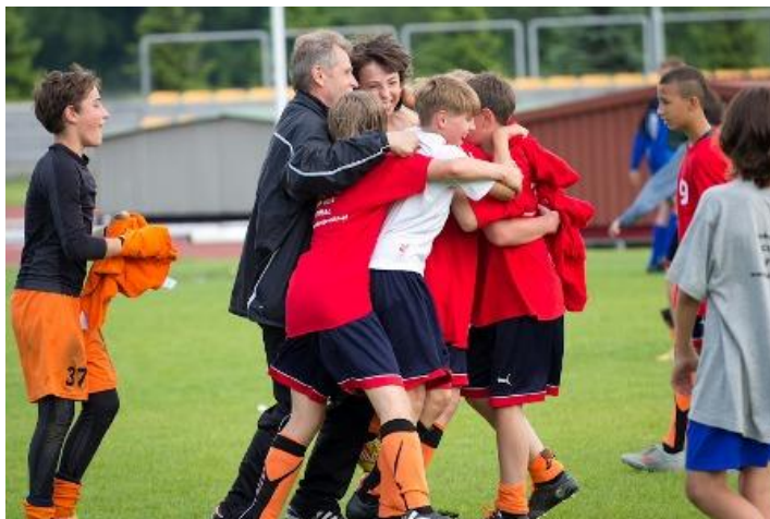
PSP nr 5 DĘBICA – MISTRZ ŁUKACIJEWSKA CUP