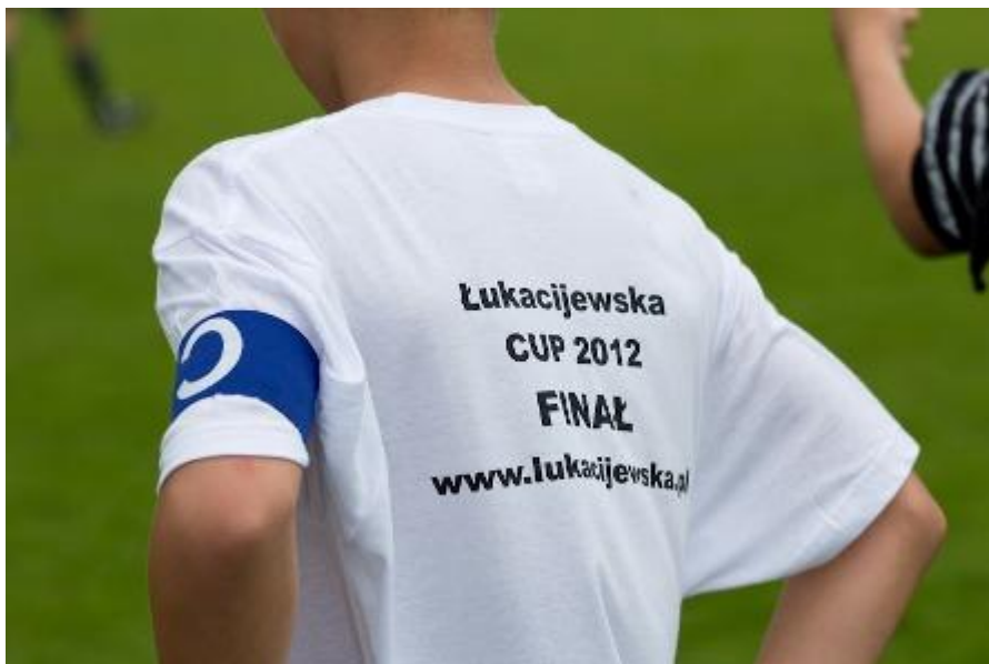
KOSZULKI W KTÓRYCH ROZGRYWANO TURNIEJ ŁUKACIJEWSKA CUP