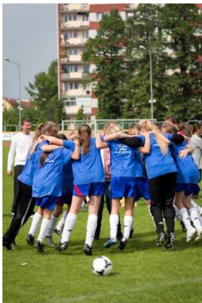
ZS GORZYCE – MISTRZ ŁUKACIJEWSKA CUP

Mistrzem województwa podkarpackiego w kategorii chłopców została drużyna PSP nr 5 z Dębicy, natomiast w kategorii dziewcząt Zespół Szkół z Gorzyc.