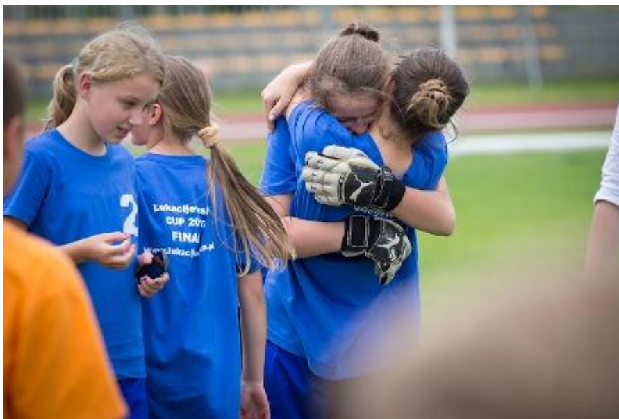
MISTRZ ŁUKACIJEWSKA CUP – ZS GORZYCE - PO ZWYCIĘSKIM MECZU FINAŁOWYM

Finał rozegrany w kategorii dziewcząt przysporzył kibicom niesamowitych emocji – spotkanie zakończyło się remisem, dlatego o tytule mistrza zdecydowały rzuty karne. Bramkarki obydwu zespołów pokazały świetną dyspozycję broniąc kolejno kilku serii rzutów karnych.