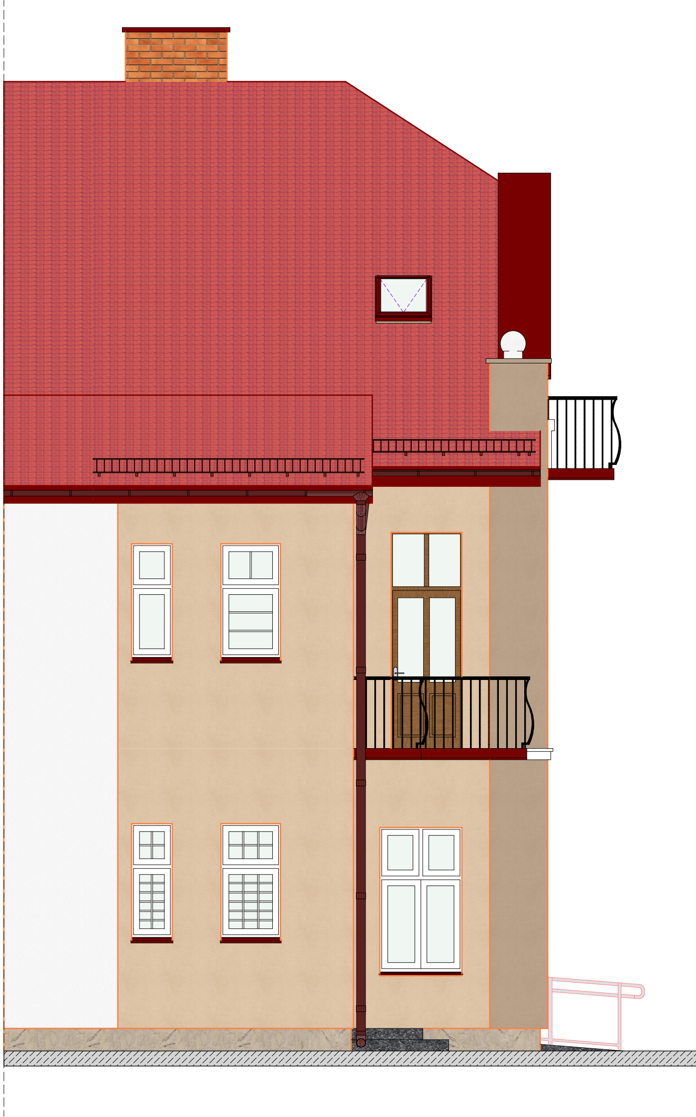
ELEWACJA E-02 (POŁUDNIOWA) - SKALA 1:50